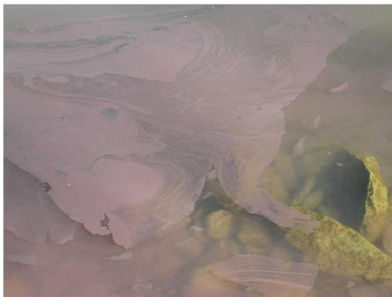
Abb. 6: Oberflächenfilm am Ufer des Zürichsees.

In einem schönen Sommer mit stabilem Wetter befinden sich die Burgunderblutalgen in einer Tiefe von 8 bis 15 Metern und damit in sicherer Distanz zu Badegästen. Als Folge wechselhaften Wetters traten 2020 aber bereits im September erste Ansammlungen von Planktothrix rubescens an der Seeoberfläche auf – noch während der Badesaison.