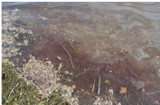
Abb 8 a: Zürich-Obersee August 2021; angeschwemmte Algen und Wasserpflanzen mit rötlich gefärbten Ansammlungen von Tychonema bourrellyi .

Grundsätzlich sind Blaualgen in artenreicher Zusammensetzung als Aufwuchsalgen im Uferbereich unserer Seen weit verbreitet. Auffällige Massenentwicklungen sind selten. Ob sich Vertreter der Gattung Tychonema künftig als bedeutende Elemente der Algenflora unserer Seen etablieren können, wird die Entwicklung in den nächsten Jahren zeigen. Das Vorkommen von Tychonema ist insofern kritisch zu beurteilen, weil bereits das Verschlucken von geringen Mengen für Hunde und Kleinkinder gefährlich ist.