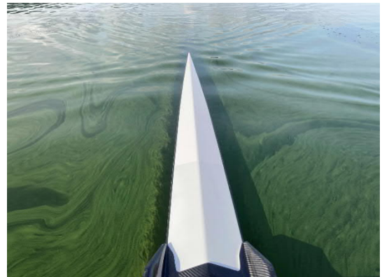
Abb 4a und b: Ruderboot Greifensee 17.11.2020; Gomphosphaeria sp.