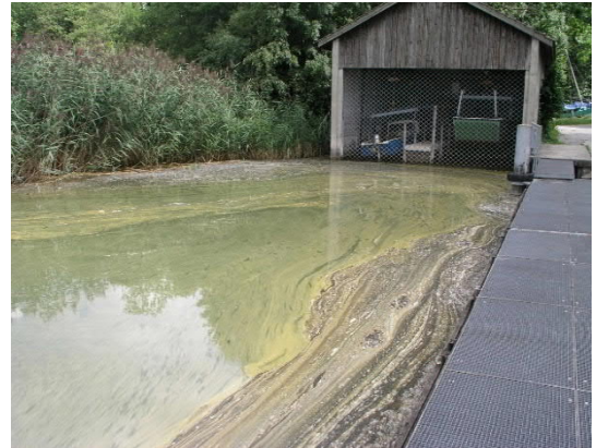
Abb 2a und b: Greifensee 10.8.2011; Microcystis aeruginosa