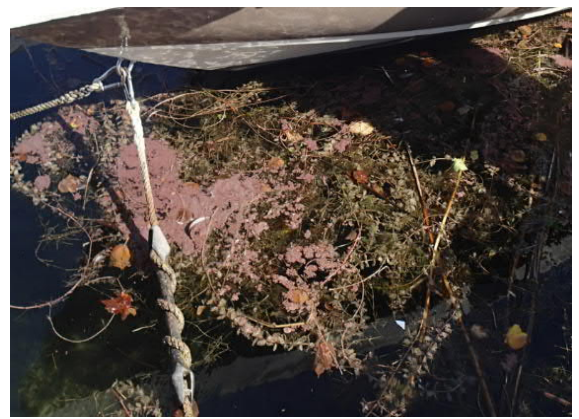
Abb. 7: Zürichsee 11.9.2020; Ansammlung von Burgunderblutalgen vermischt mit Wasserpflanzen zwischen Booten