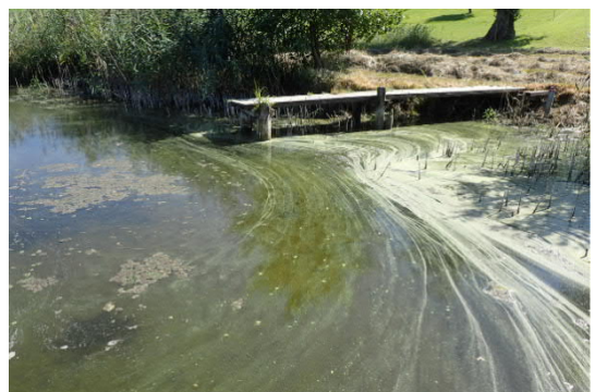
Abb 5a und b: Hüttnersee 27.8.2022 und 6.9.2022; Microcystis aeruginosa