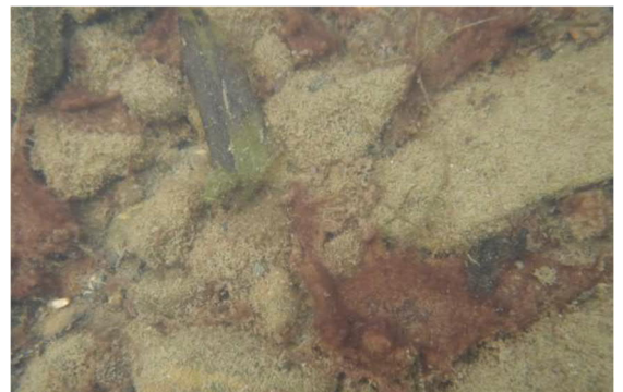
Abb 8 b: Zürich-Obersee August 2021; Algenaufwuchs auf Steinen mit rötlich gefärbten «Krötenhäuten» von Tychonema bourrellyi .