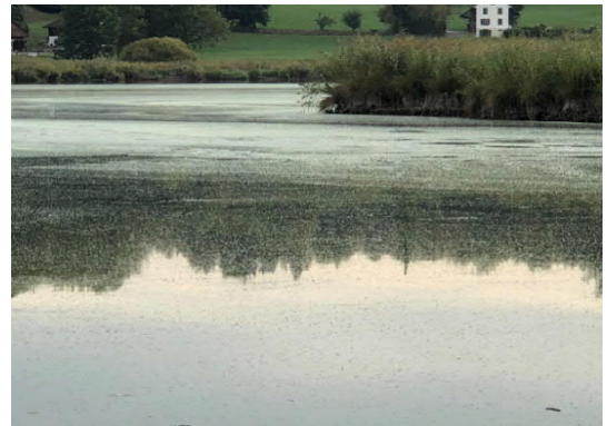
Abb 3a und b: Lützelsee 28.8.2018; Aphanizomenon flos-aquae