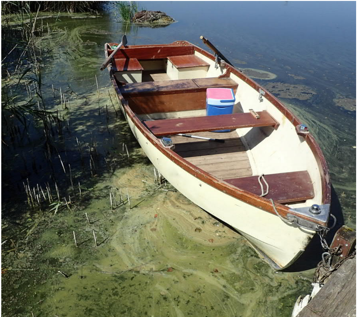
Abb. 1: Ansammlung von Blaualgen am Ufer des Hüttnersees im Sommer 2021.

Es gibt mehrere tausend Arten von Blaualgen auf der Erde, die man in ganz unterschiedlichen Lebensräumen im Wasser und an Land findet. In unseren Seen und Fließgewässern kommen Blaualgen das ganze Jahr über weit verbreitet vor. Einige Arten enthalten neben grünen Pigmenten blaues Phycocyanin. Sie sind daher blau-grün gefärbt, was die Namensgebung begründet. Die Bezeichnung Blaualgen gilt aber für alle Cyanobakterien, auch für die Arten, die kein Phycocyanin haben und gelb, grün, braun oder sogar rot gefärbt sein können. Einige Arten können Stoffwechselprodukte bilden, die für Mensch und Tier giftig sind. Bei Massenvorkommen von Blaualgen ist daher Vorsicht geboten.